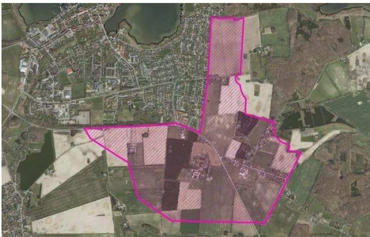
Ønske til udviklingsområde ved Præstø.

Vi vil ansøge staten om udlæg af et større udviklingsområde øst for byen – omfattende Lundegård og Enegårde. Udlægget skal sikre, at der inden for området kan ske udviklingstiltag, som kan understøtte landsbyerne og fremtidig byvækst ved Præstø. Afgrænsningen af området tager udgangspunkt i landskabsanalyser og naturudpegninger i form af ”Grønt Danmarkskort”.