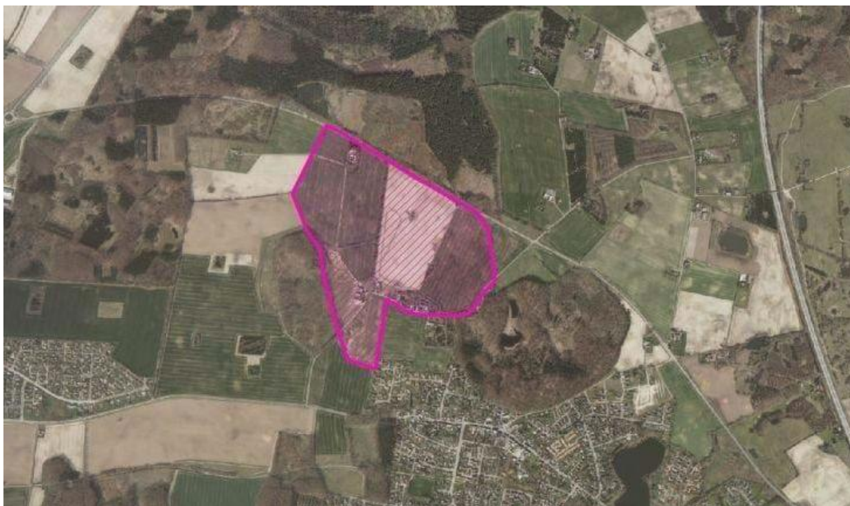
Ønske til udviklingsområde ved Nyråd/Græsbjerg.

Gennem natur- og landskabsanalyser kan der udpeges et større udviklingsområde omkring Græsbjerg. Udbygningen ligger i forlængelse af allerede planlagte områder i Nyråds nord-vestlige hjørne, og vil muliggøre en fremtidig byvækst, samt skabe udviklingsmuligheder for landsbyen Græsbjerg.