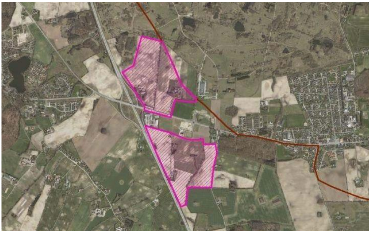
Ønske til udviklingsområde ved Afkørsel 41 - Kystnærhedszonen markeret med brun streg.