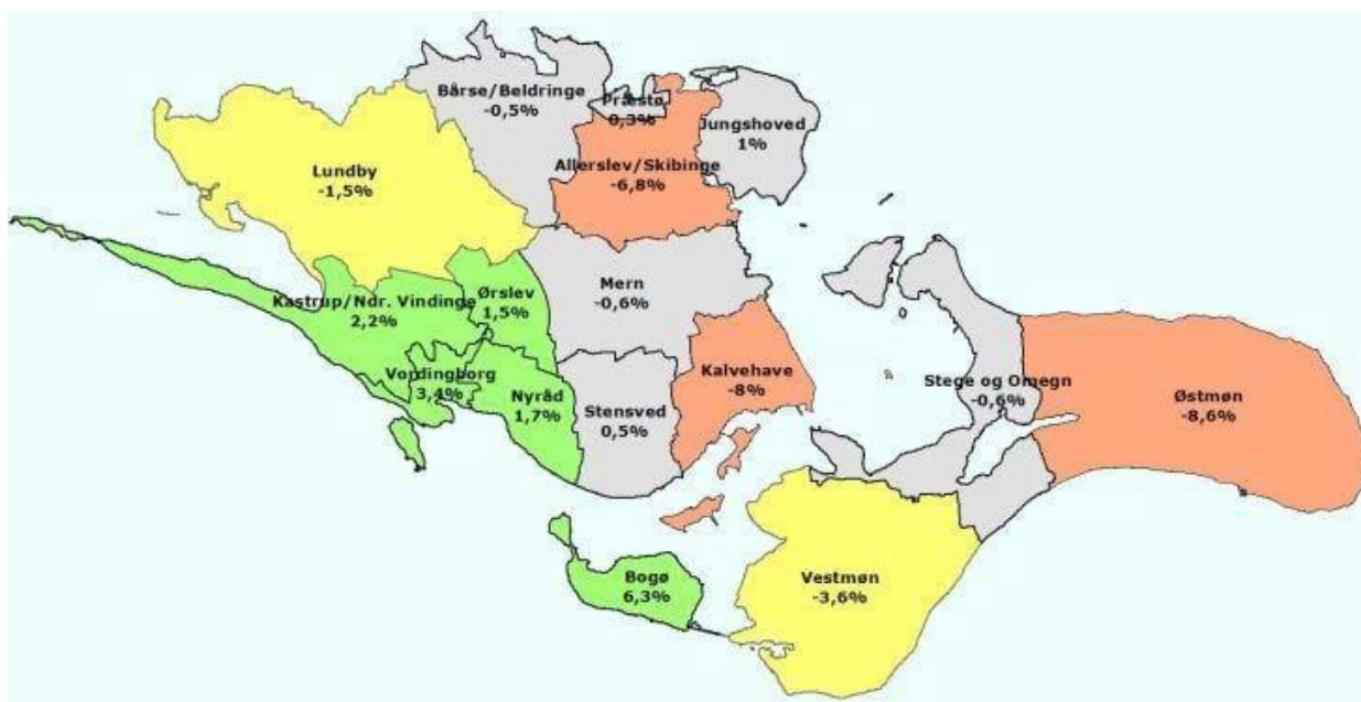
Udviklingen i indbyggertallet i de 16 lokalområder (2012-2019)

Befolkningsudviklingen varierer geografisk, hvor området omkring Vordingborg i perioden 2012-2019 har oplevet fremgang, mens andre dele af kommunen har haft tilbagegang i indbyggertallet. Se nedenstående kort.