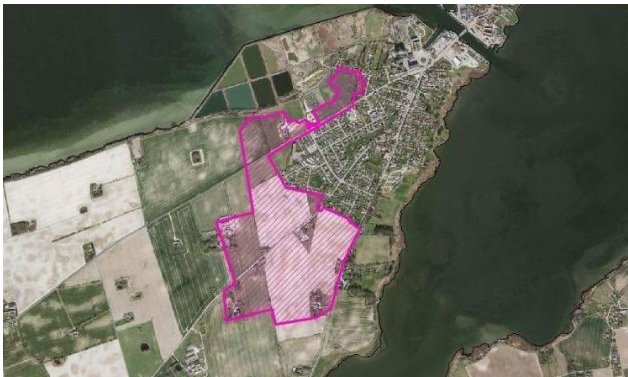
Ønske til udviklingsområde ved Stege (Lendemarke).

Vi vil ansøge staten om udlæg af et udviklingsområde omkring Lendemarke, dels op til jordbassinerne og dels ud langs Grønsundsvej, hvor afgrænsningen tager udgangspunkt i de større bygningssæt, der ligger i dette landskab. Afgrænsningen tager herudover udgangspunkt i udpegning af oversvømmelsestruede arealer, landskabsanalyse og naturudpegninger i form af "Grønt Danmarkskort".