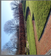
Udekirken i Ørslev