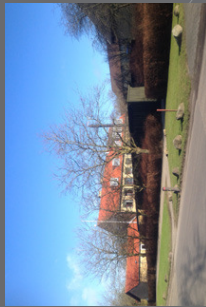
Skolen i Ørslev