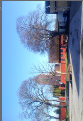
Kirkepladsen i Ørslev