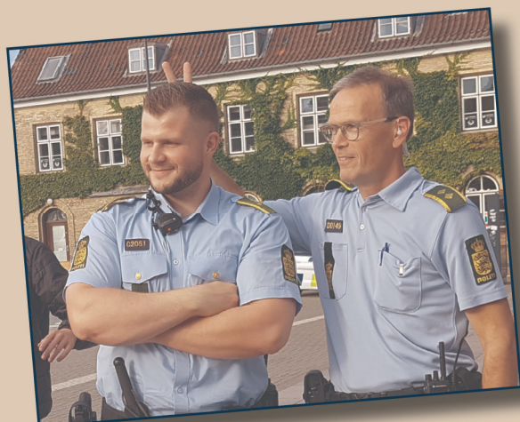
Joachim Olsen og Poul Erik Højte Skov Lokalpolitiet