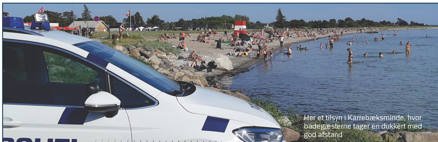
Her et tilsyn i Karrebæksminde, hvor badegæsterne tager en dukkert med god afstand

NYHEDSBREV OM SAMARBEJDET MELLEM DIT LOKALRÅD OG SYDSJÆLLANDS OG LOLLAND-FALSTERS POLITI